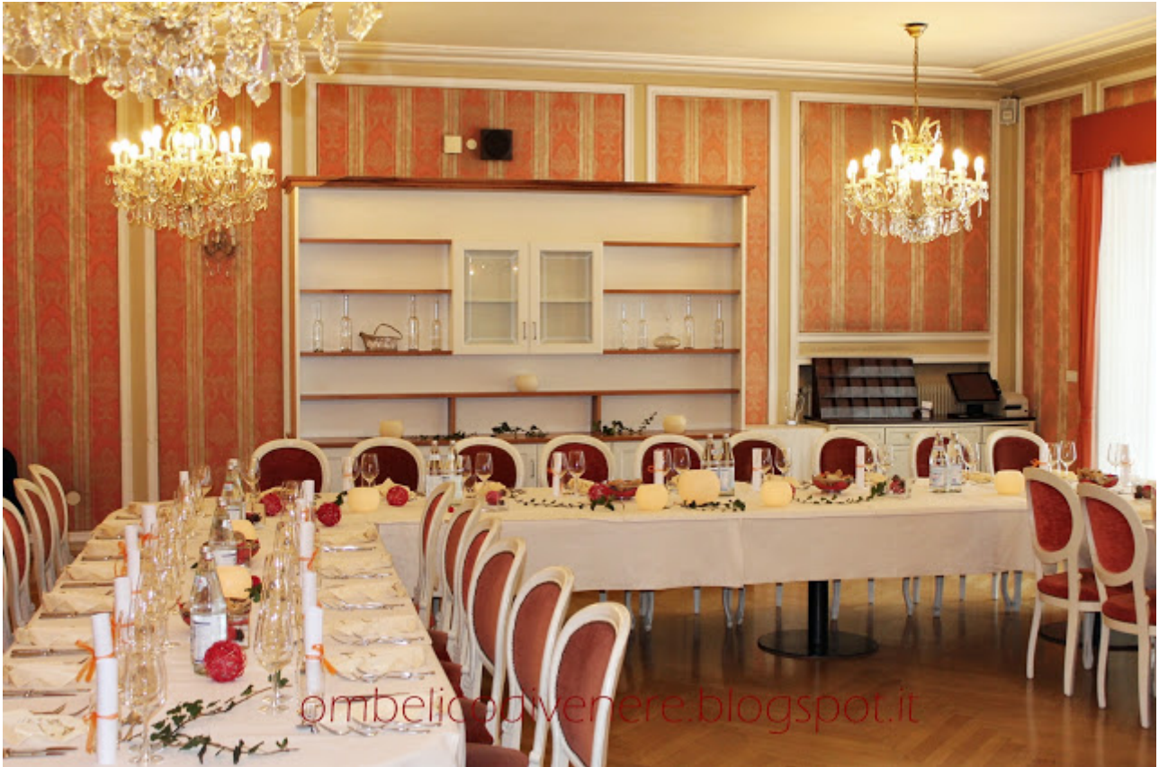
la sala da pranzo

Alla fine della gara siamo rimaste in quattro chiamate a cucinare un menù completo per una giuria composta da giornalisti del luogo, lo staff youredo, il direttore della scuola e altri ospiti.