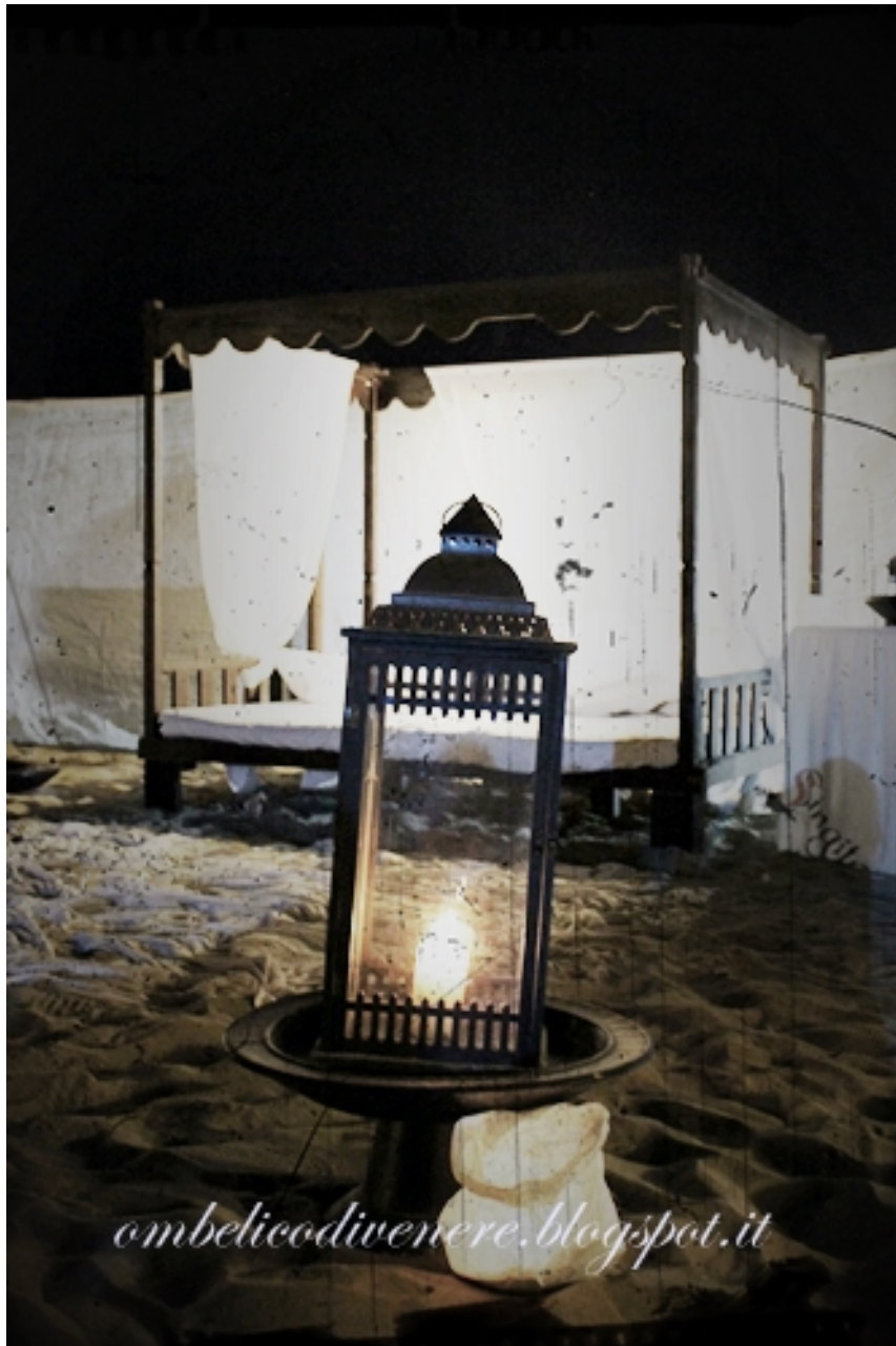
Bagno Singita estate 2013