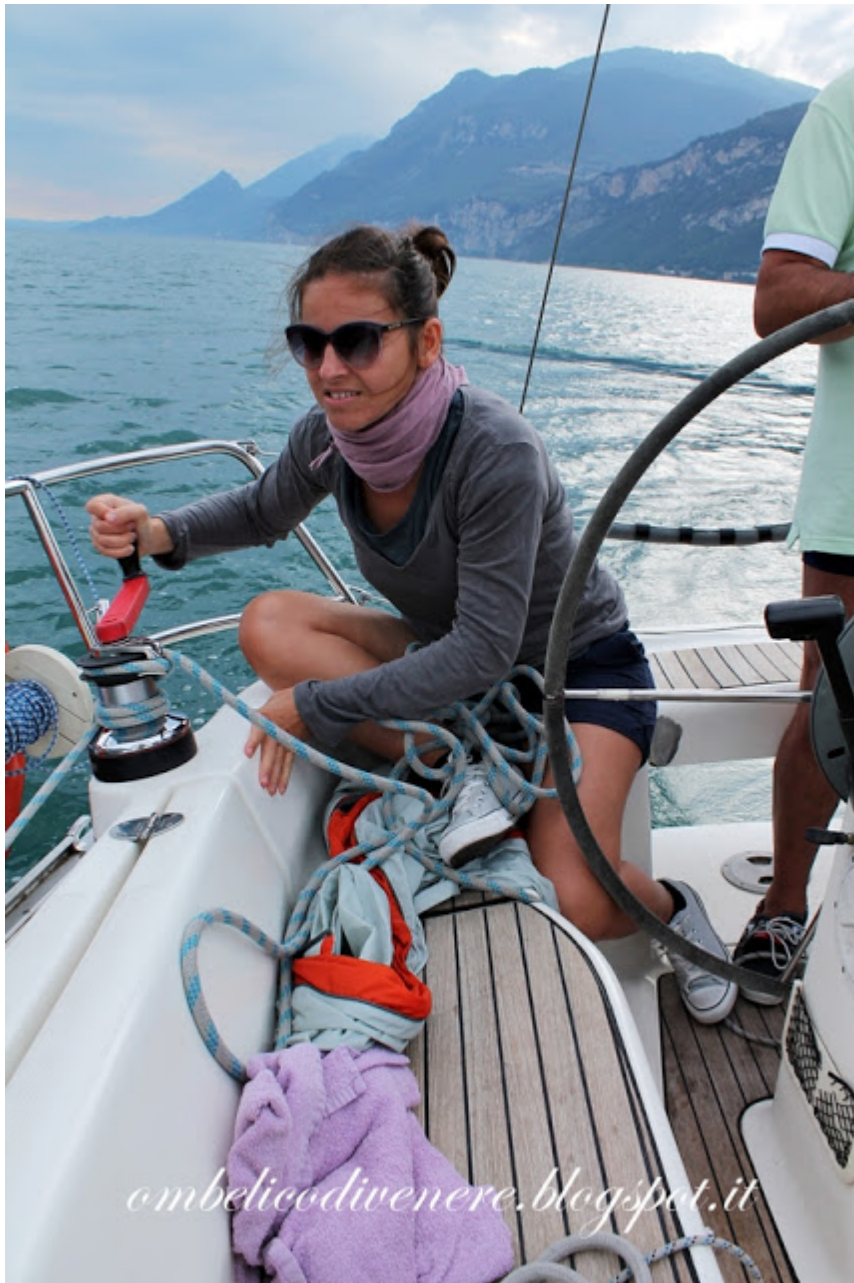
Lago di Garda estate 2013