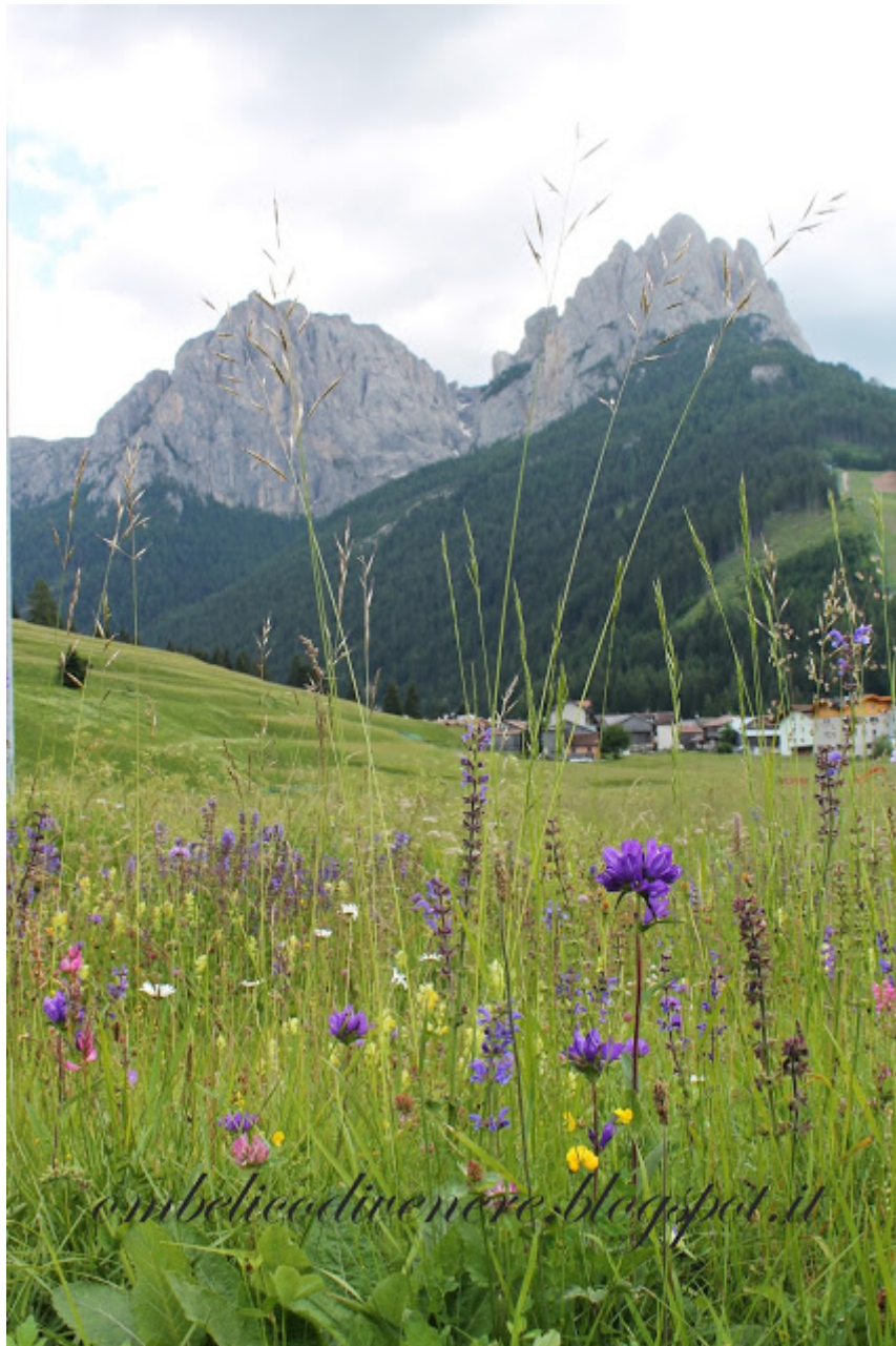
Val di Fassa estate 2013