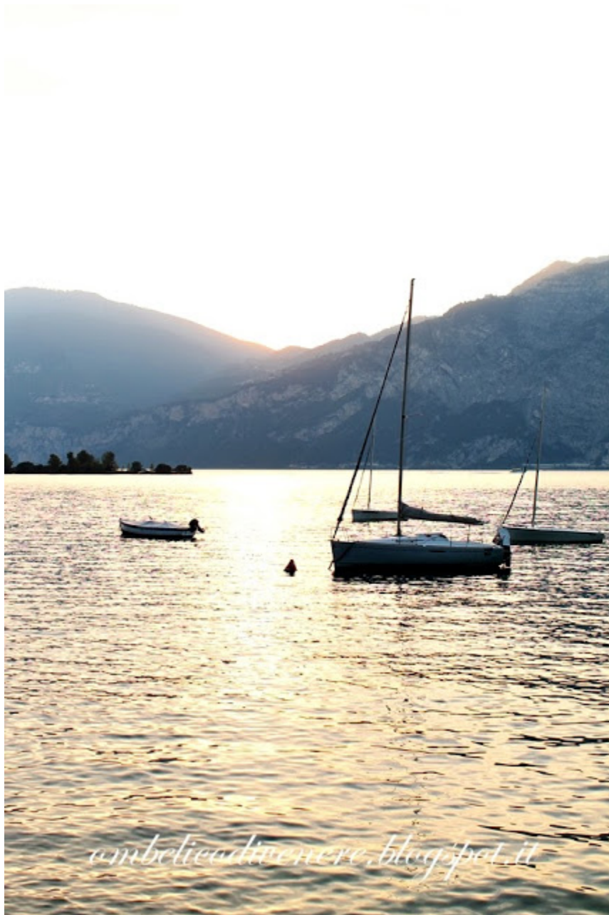
Malcesine Lago di Garda estate 2013