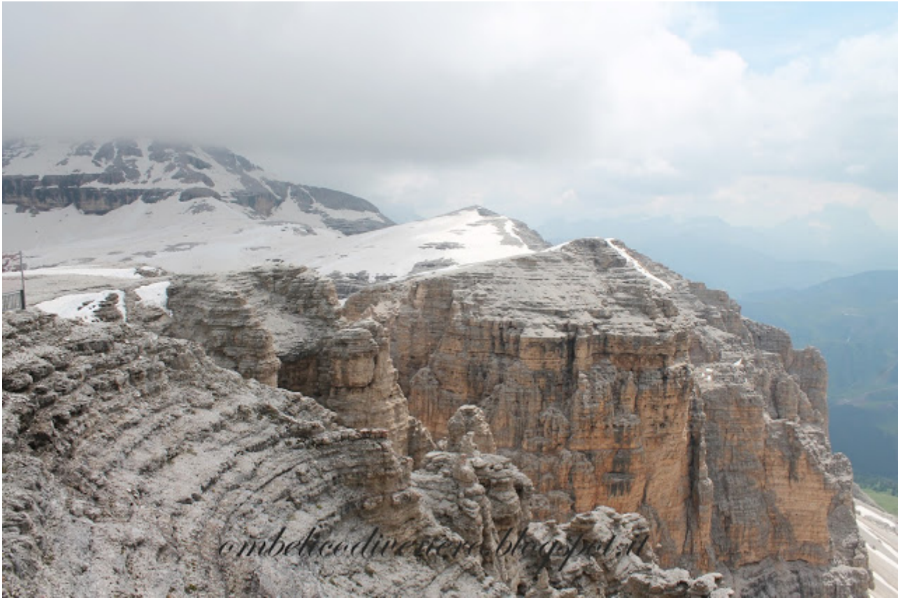
Sass Pordoi estate 2013