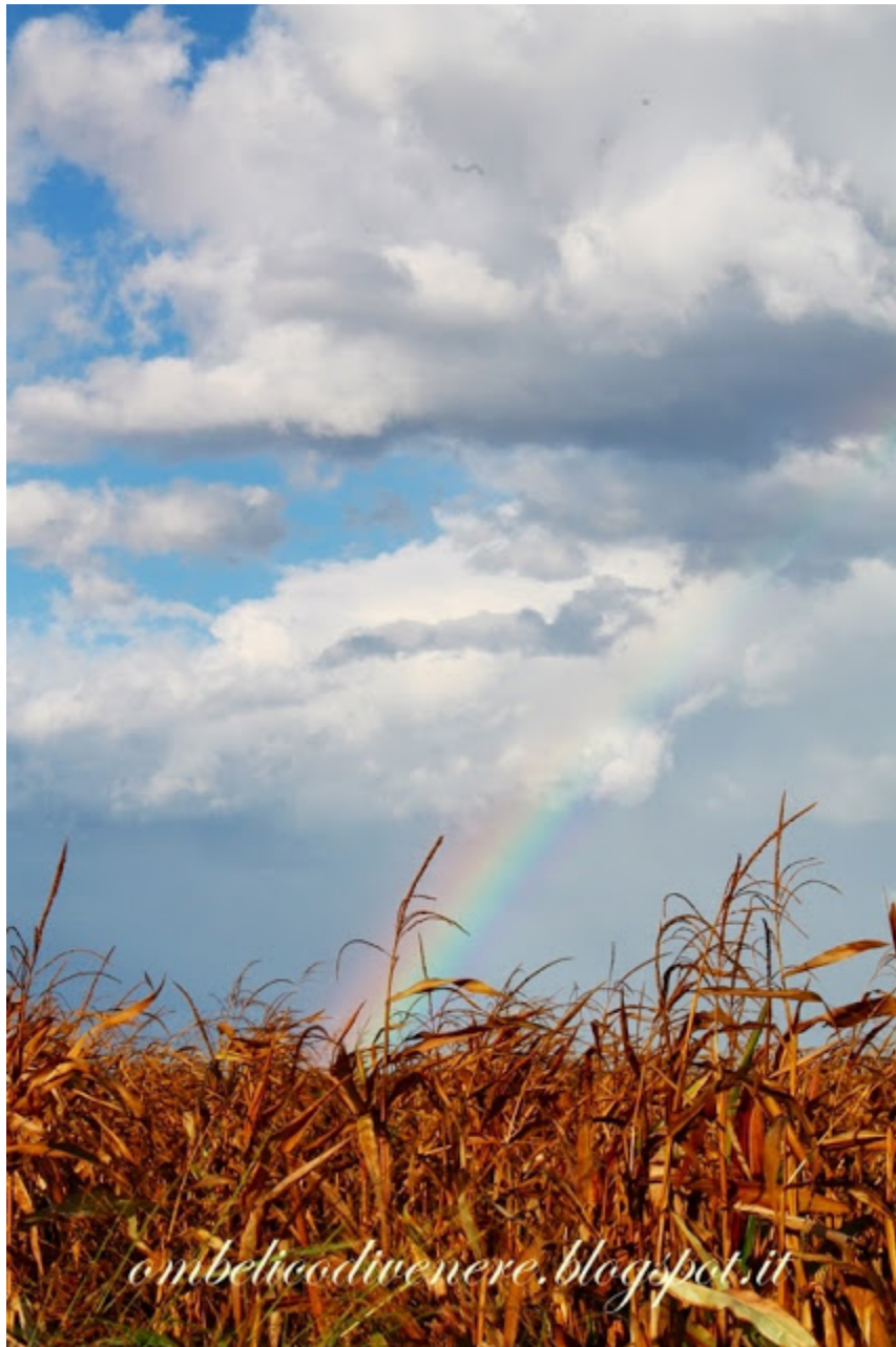
la quiete dopo la tempesta