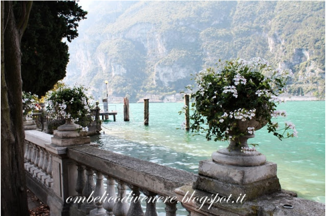
Riva del Garda estate 2013