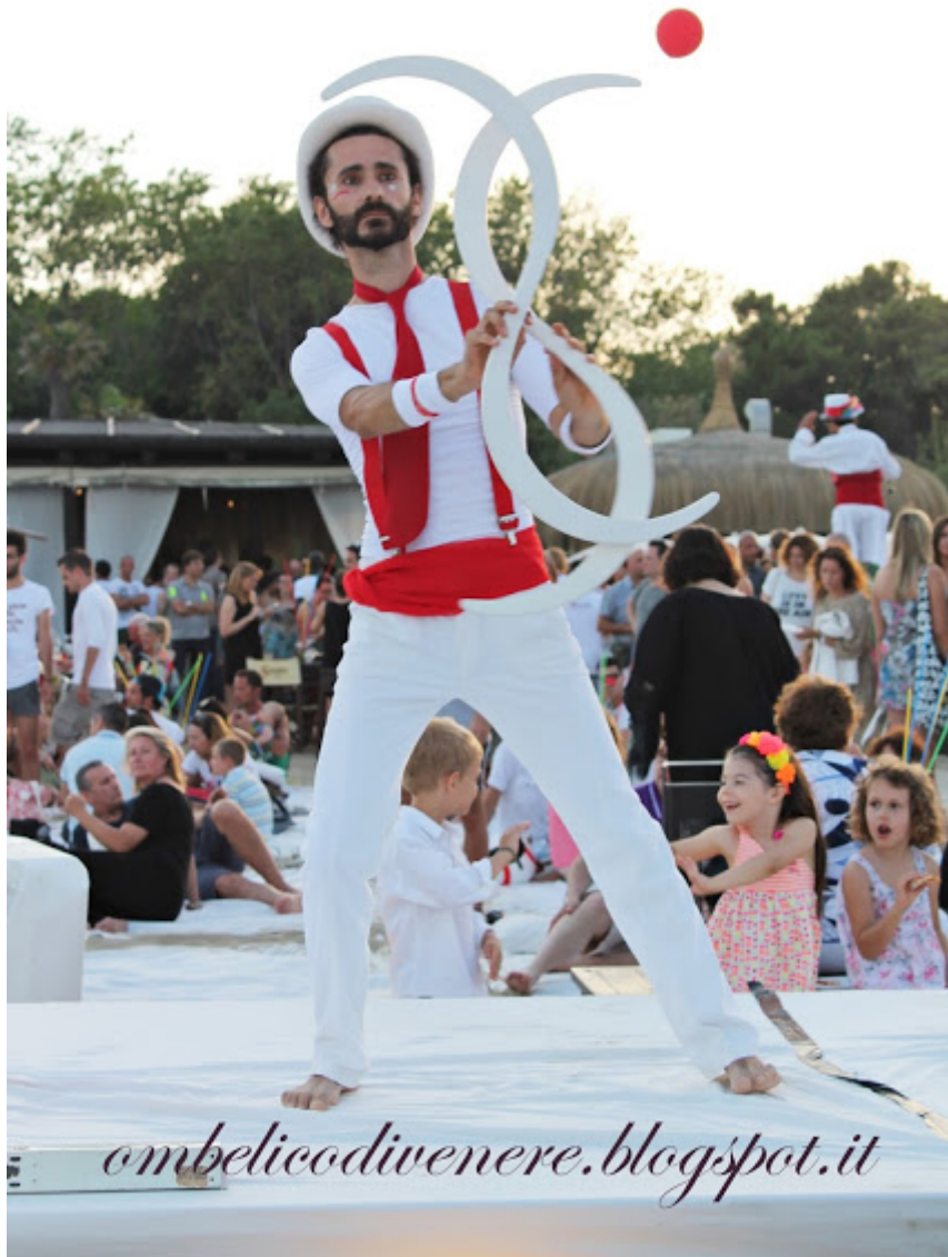
Bagno Singita estate 2013