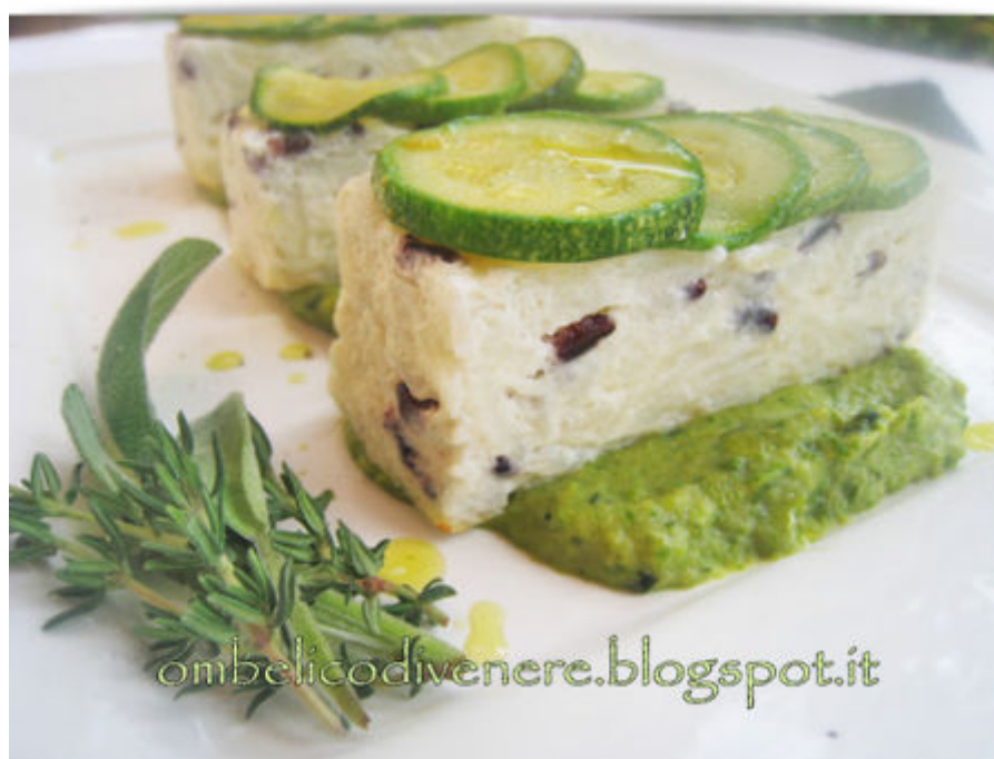
CUBETTI DI RISO SU CREMA DI ZUCCHINE per due persone

Ho ricercato la ricetta, catalogata sotto antipasti alla categoria formaggi c'è lui in prima pagina, l'ho un po' adattata, anche per quello che avevo in frigo.. che fortuna ho pure la panna!!! Non sapevo bene cosa sarebbe saltato fuori, se gli sformatini si sarebbero sgretolati o sarebbero rimasti in forma, se il risultato sarebbe stato asciutto.. beh la forma è rimasta perfetta e sono cremosi e saporiti al punto giusto!! una sorpresa!!