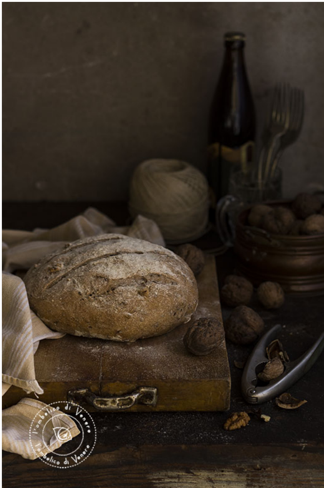
PANE SEMI INTEGRALE ALLA BIRRA E NOCI

Utilizzatelo per accompagnare gustose insalate, preparare bruschette o per colazione con la marmellata!!