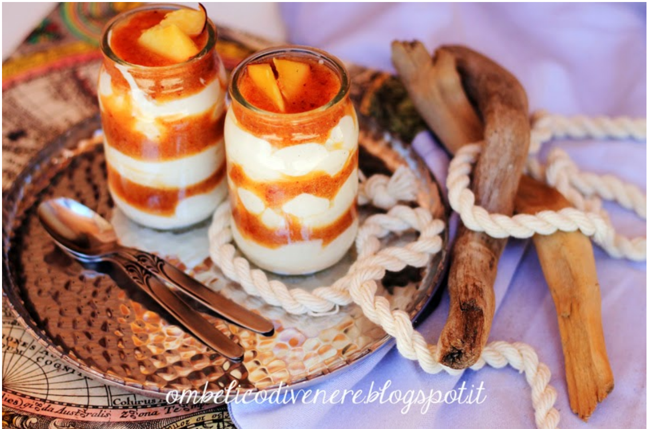
Mousse light con purea di pesche al sambuco