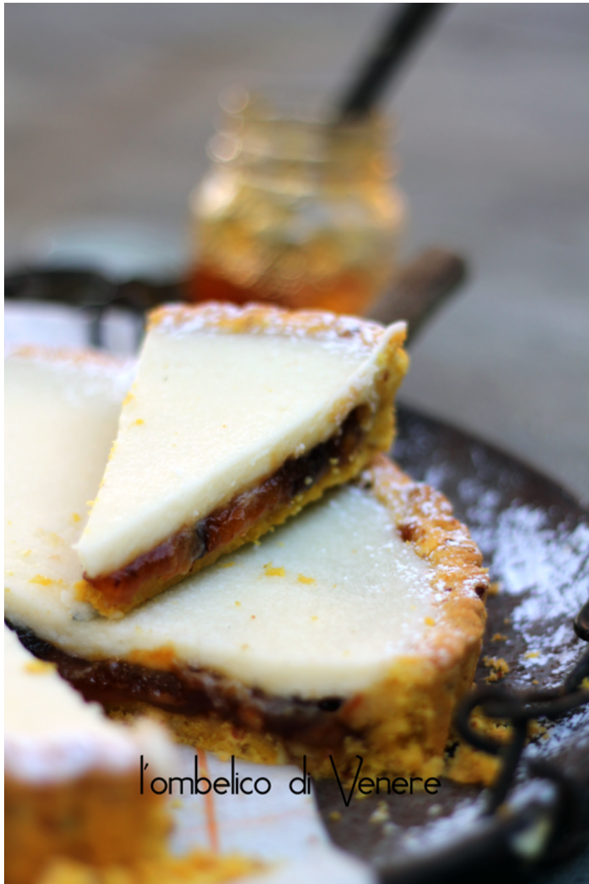
l'ombelico di Venere