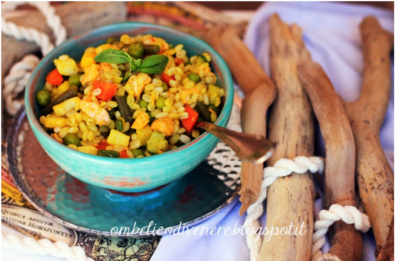
Orzo arcobaleno allo zafferano (con seppie e salmone)