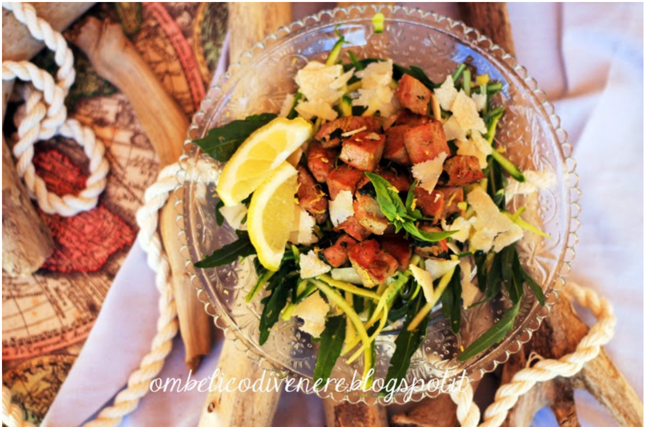
Tonno in verde (rucola, zucchine crude, grana e salsa al basilico)